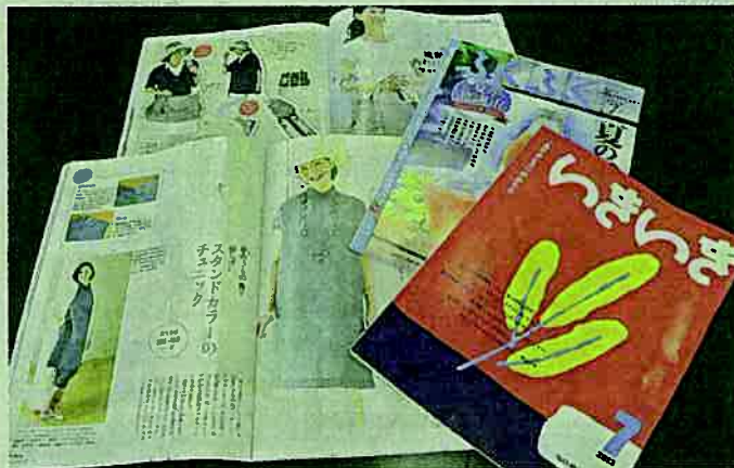
ヘッドハンティングで編集・販売部門を強化し、発行部数を伸ばす「いきいき」

なかった。それが逆に「挑戦してみよう」と興味をわいたのと「自いう気持ちが生まれ、分の市場価値を知りた」と思い、ヘッドハンターと面会。男性の経歴や性格をきちんと分析した上での転職の誘いに、「第二の人生で製品の寿命が短くな